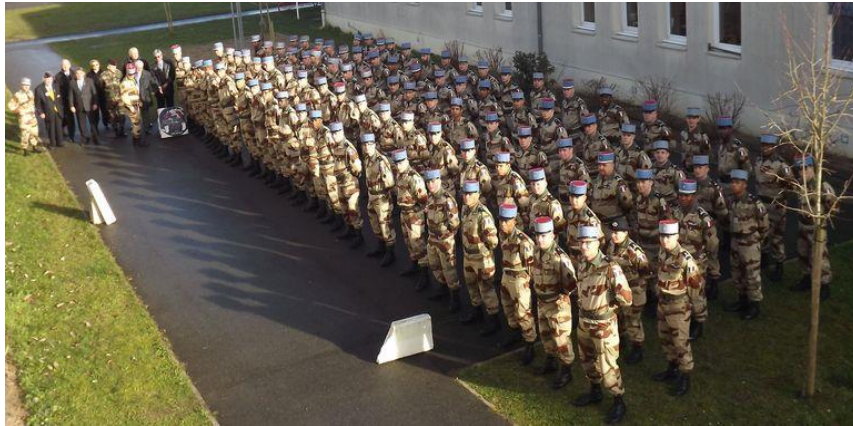
Le 1/12 rassemblé

C'est ensuite que les cadres et militaires du rang du 1er escadron, se sont vus remettre l'insigne du 1er régiment de cuirassiers par les anciens présents :