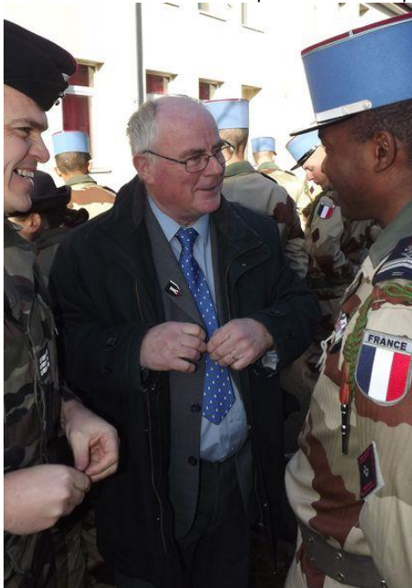
Le général de Roodenbeke lors de la remise des insignes